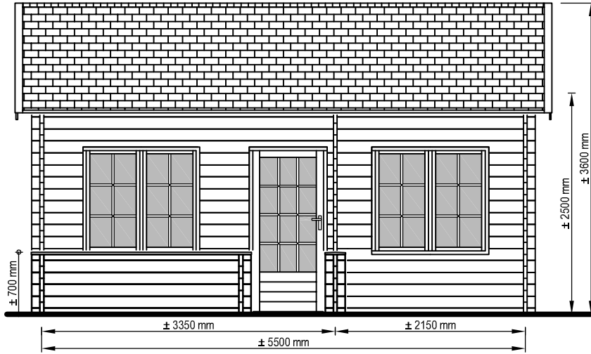
Zij aanzicht Seiten Ansicht Side view

Het is niet toegestaan om bouwtekeningen, bouwtekeningen en foto's van zowel de Prima serie als de Blokhuus serie te kopiëren, te verspreiden of te verspreiden. Het is niet toegestaan de tekeningen van LUGARDE®/Wuestman B.V. Model en materialen af te kopiëren of te verspreiden. LUGARDE® en het 3=1 systeem zijn geregistreerde handelsmerken. Het Prima 3=1 systeem is ontwikkeld en gepatenteerd door LUGARDE®/Wuestman B.V.